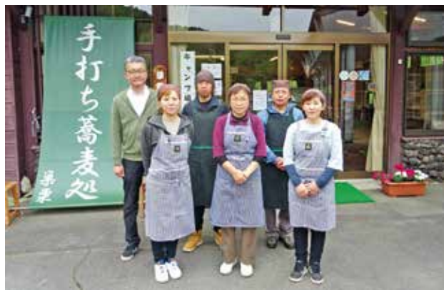
武石の観光を担う観光センターの皆さん

「安心・安全な運営をモットーに、来場者に楽しく利用してもらうよう日々開業しています。武石の皆様のご利用をお待ちしています」とのメッセージを頂きました。