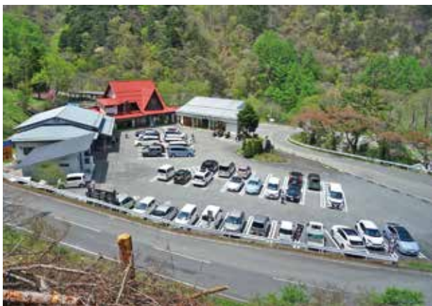
観光客で賑わう大型連休(令和4年5月5日)

武石観光センターは、食事処「棠栗」、お土産売店、釣堀、棠栗キャンプ場を運営しており、令和3年度には全施設を合わせて約8,500人の利用客があったそうです。コロナ禍での対策方法や知識の広まり、またマスク着用ルールの緩和などにより、車で外出する家族やグループが増えて来ており、令和4年度はコロナ前の7～8割まで回復するのではないかと今後の客足に期待を寄せています。