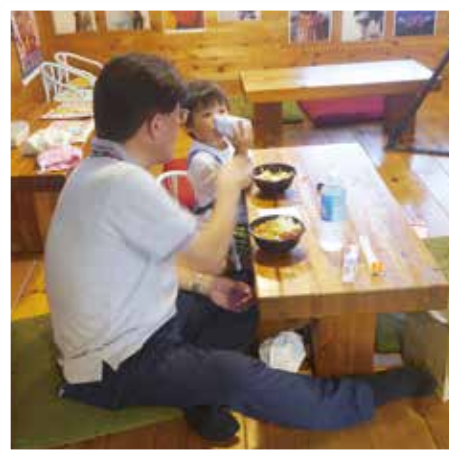
カツカレーおいしかった

また、余裕のある方には、野菜や食材の提供、運営費のカンパなどの協力をお願いしたいと話しています。