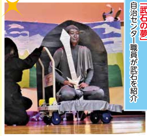
「武石の夢」 自治センター職員が武石を紹介