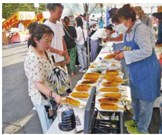
焼トウモロコシ好評でした