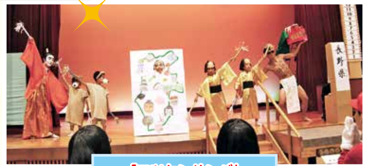
「マツケンサンバ」 家族みんなでマツケンサンバ