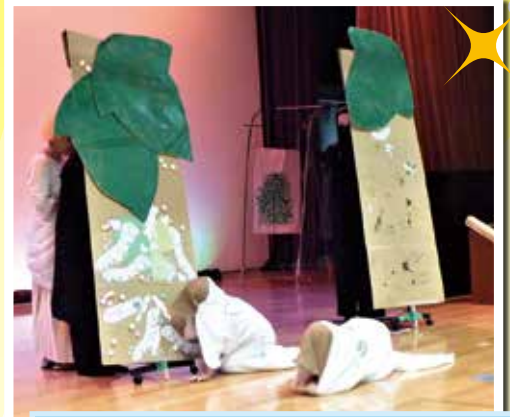
「蚕の一生」 身体でかわいい蚕を紹介したかったのです