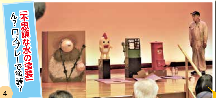
「不思議な水の塗装」 ん? ロスプレーで塗装?