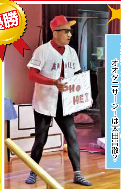
「夫婦でなぞかけダジャレ」 オオタニサーン! は太田冒散?