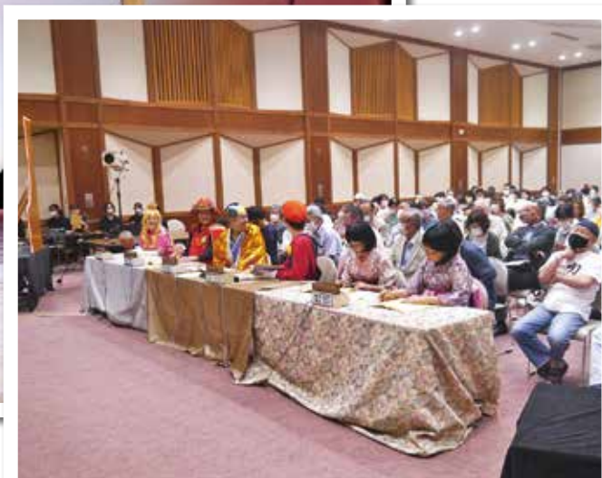
審査員の皆さんも仮装して採点