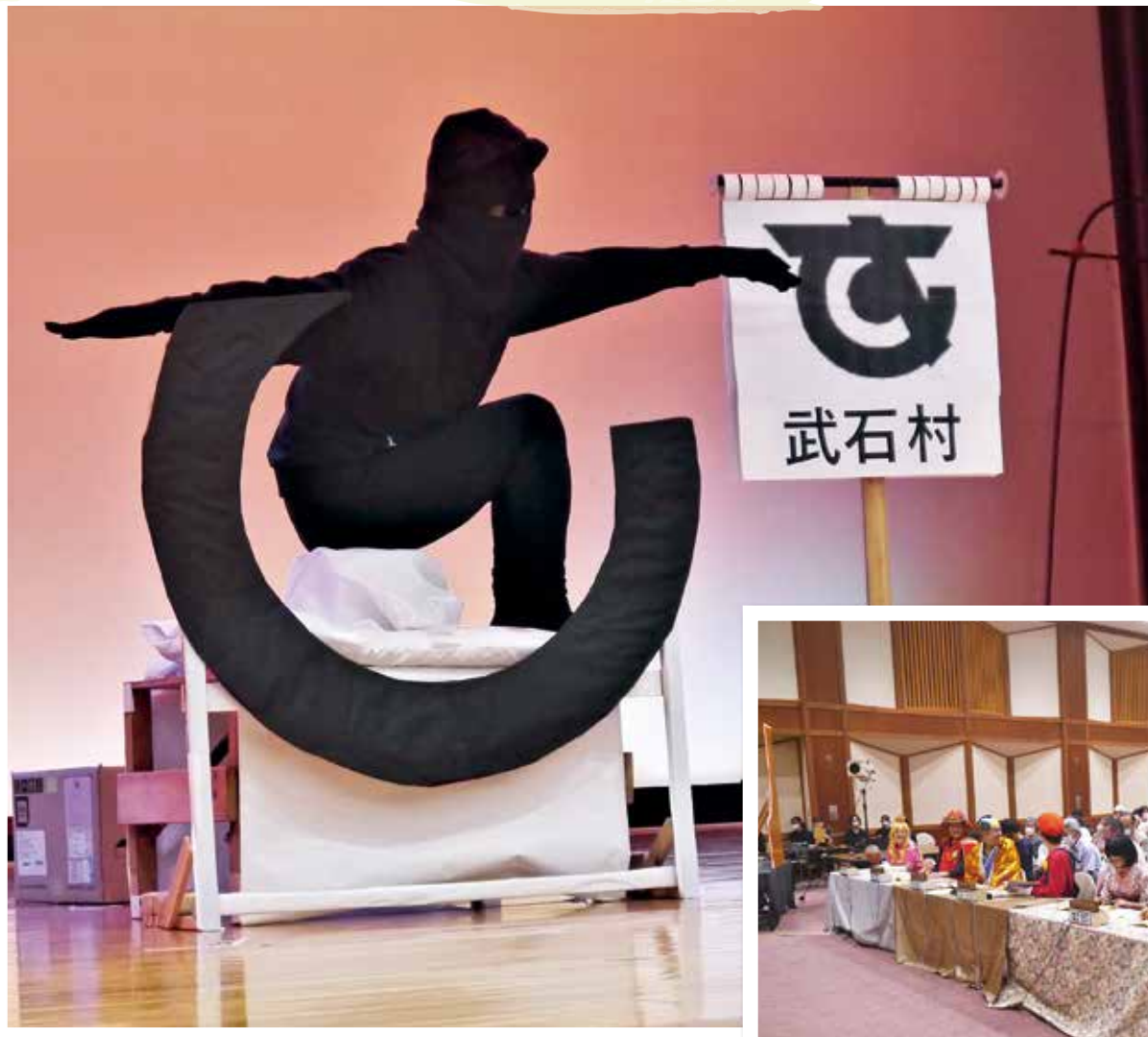
テーマ 市町村のマーク