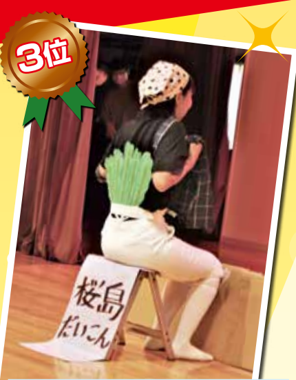
「大根採ったどおー」 立派な「おみ足」と「おしり」でした