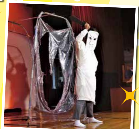
「知らなきや仏像」 鳥屋の道祖神、小沢根の不動明王を みんなに知ってもらお