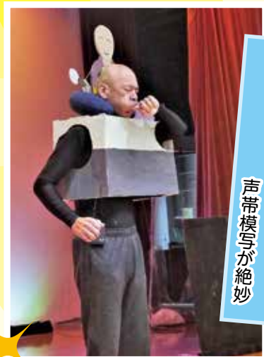
「武石郵便局長賞」 「木魚」 ポクポクポク・ 声帯模写が絶妙